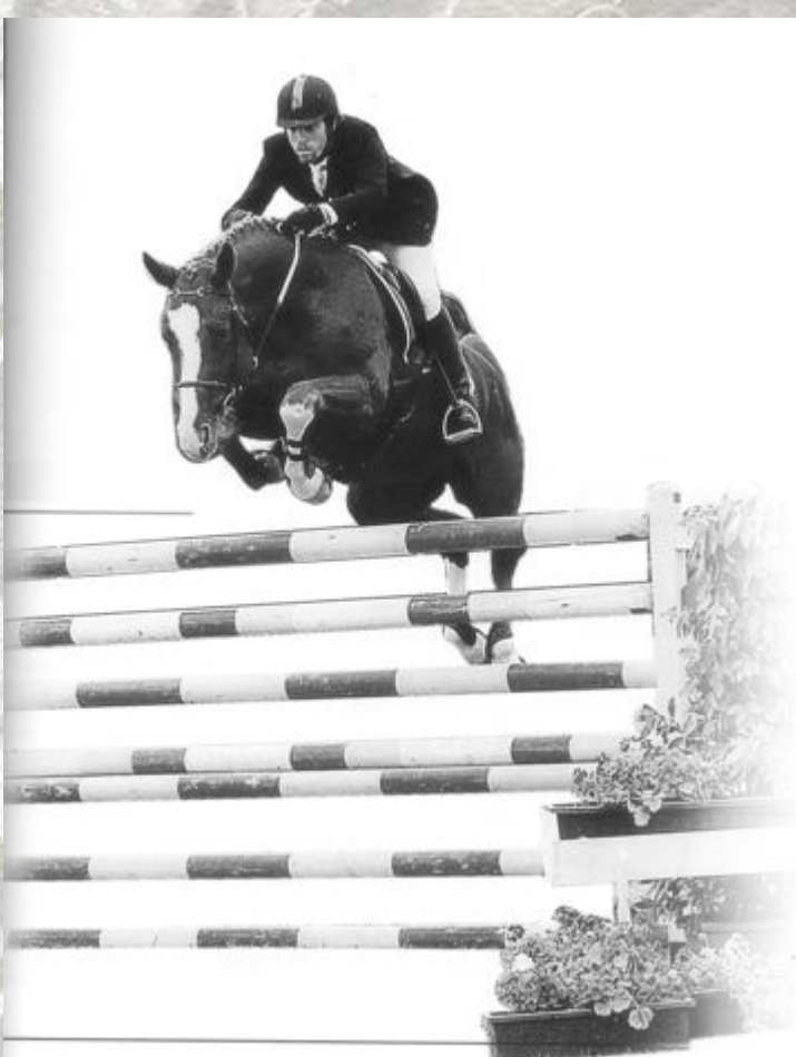
Ehrentanz M, Hannover, '95