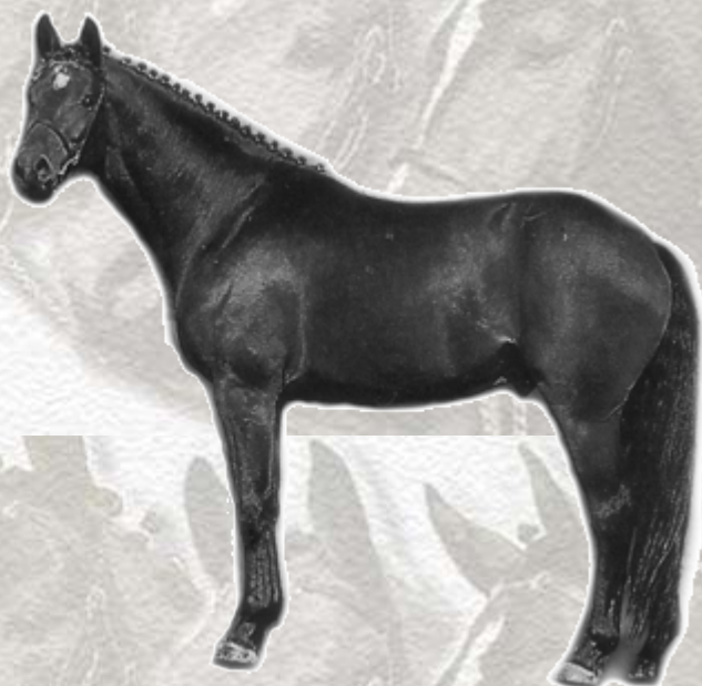
Lüstling M approvato stallone al Performance Test 2000/2001: 4° classificato, Holst, da Libertino e Dalida II