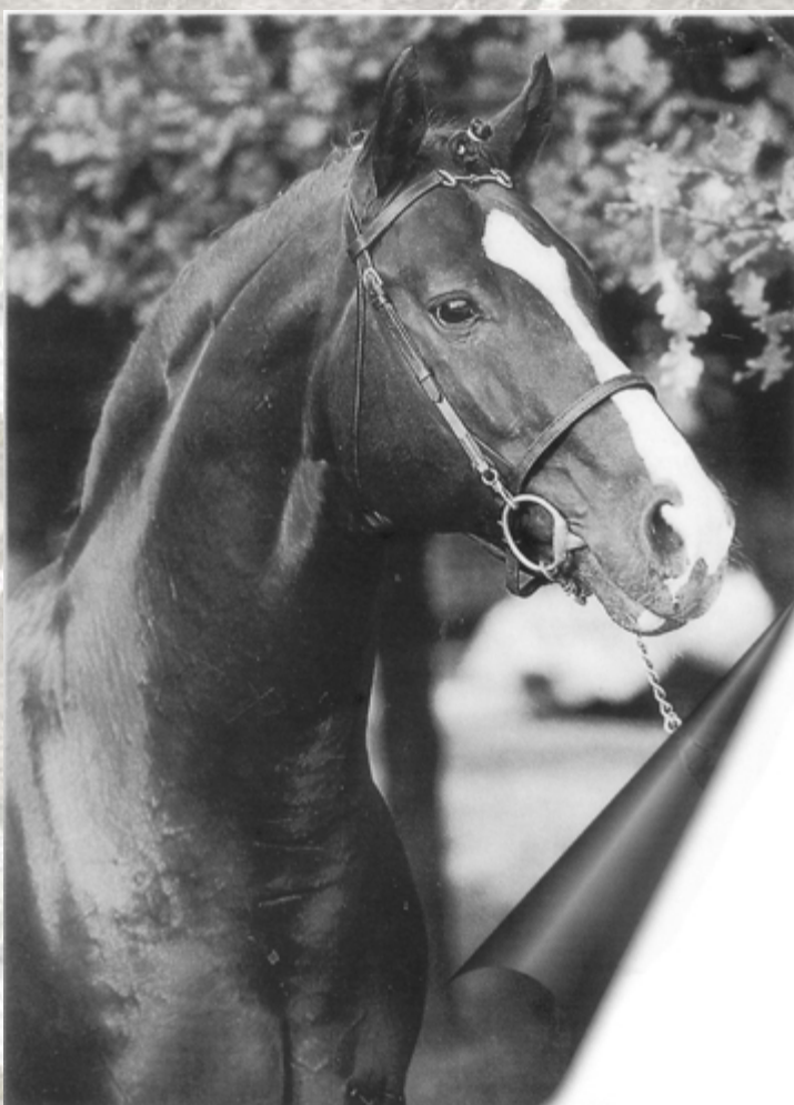
Lo stallone Grand Royal M - Hannover, '92

Generale la soddisfazione, tanto degli organizzatori quanto degli intervenuti: il successo si è potuto stimare sia in termini quantitativi, per la folta presenza di allevatori giunti dalle più diverse regioni italiane, sia in termini qualitativi, per il livello decisamente alto di tutti i soggetti presentati.